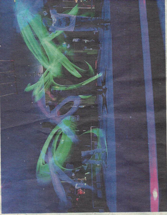
Eine Gruppe bei den Proben für das „Poi-Schwüngen“.